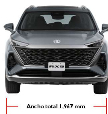
Ancho total 1,967 mm