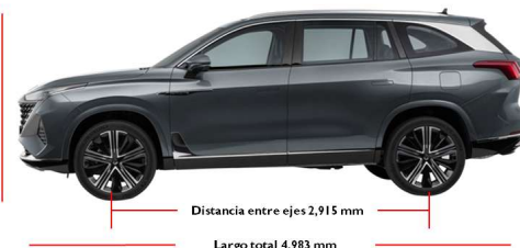
Distancia entre ejes 2,915 mm